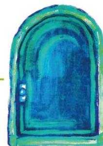
JÄRJESTÖJEN JA SEURAKUNTIEN PALVELUT

Kohtaa – kuule – tunnista – kysy – ohjaa